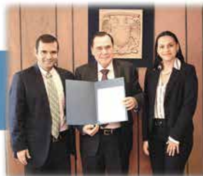
Instituto de Estudios Avanzados Universitarios IDEAUNI Fisioterapia