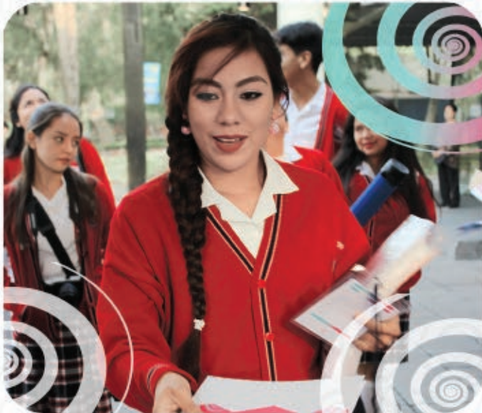
Alumna del SI registrándose al evento