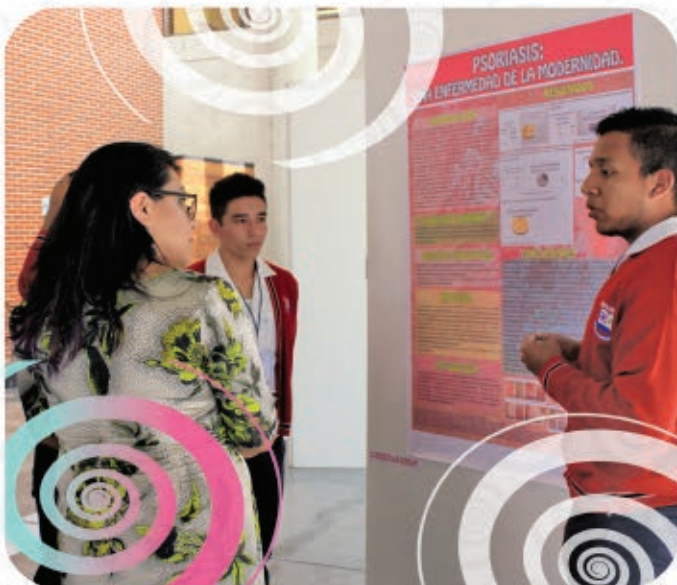
Exposición de cartel