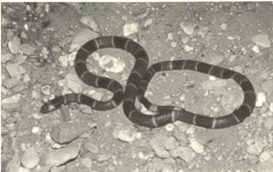
Micrurus browni browni

Cerca de Acapulco, Cuernavaca y toda la selva baja intermedia hay una especie de coralillo, Micrurus laticollaris , que tiene algunas bandas negras seguidas de amarillo pero otras seguidas de rojo. La diferencia mencionada en los libros ya no es tajante. En la región de Los Tuxtlas y en Catemaco, Veracruz, hay coralillos que no tienen bandas amarillas y que a veces tampoco tienen bandas negras, excepto una en la nuca ( M. limbatus ). En la región del Amazonas, existe una especie que no tiene rojo, sólo bandas negras y blancas ( M. langsdorffi ) y en Los Tuxtlas, norte de Oaxaca, Chiapas y centro de Guatemala hay una especie que tiene franjas gruesas café anaranjado y franjas angostas blancas y negras ( M. elegans ). Para mayor información sobre éstas y otras serpientes venenosas, el lector puede consultar el libro de Campbell y Lamar.