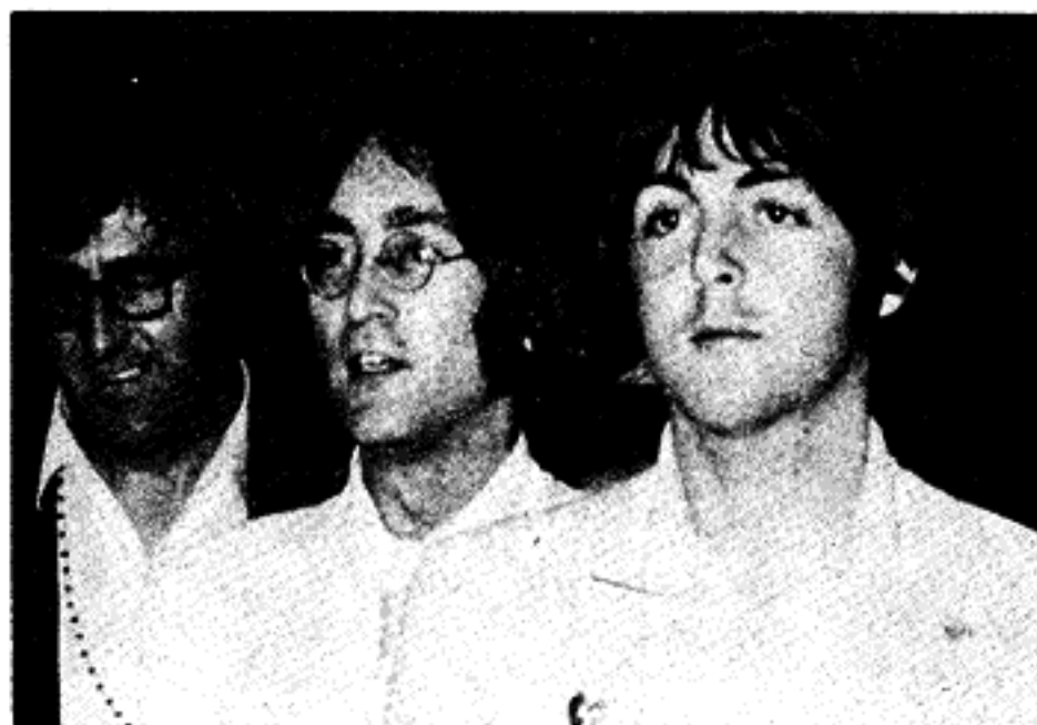
El encumbramiento de los Beatles muestra una juventud que sale de un profundo letargo. La pasividad ha quedado atrás.