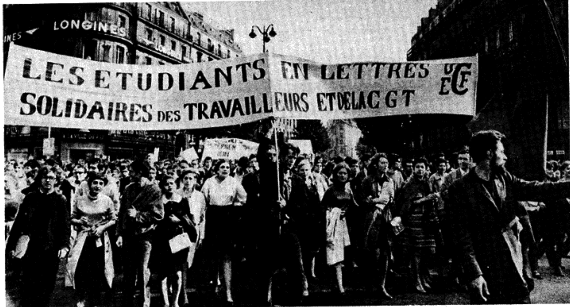
Mayo de 1968: París es sacudido por una ola de violencia estudiantil y obrera de gran alcance.

trabajaban hasta 18 horas diarias y les pagaban $450.00 al mes; era el inicio de una crisis que después se llamaría "proletarización del trabajo intelectual". Uno como estudiante veía el futuro que le esperaba: se entraba a la Universidad y se pensaba que con un título se ascendería en la escala social, pero ante una huelga como la de los médicos, se percataba de que esto no sucedería.