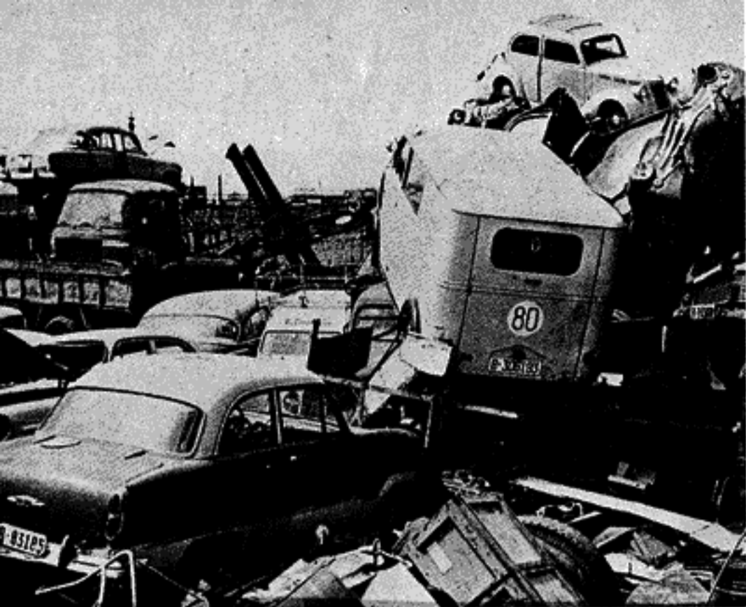
Una de las facetas del capitalismo en la década de los 60 es la sociedad de consumo; la otra es la miseria.

Lo primero que el MURO hace es atacar a los medios de comunicación como el cine, destruyen el Auditorio de Química porque se estaba pasando una película cubana, golpean asambleas en Filosofía e intentan lo mismo en Ingeniería y en Prepa 9.