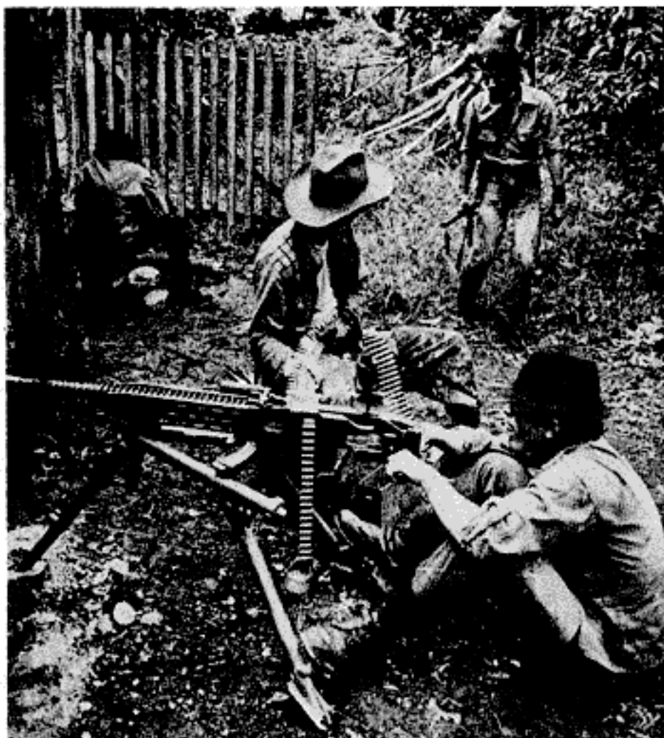
En los sesenta surgen los brotes guerrilleros en Birmania, Bolivia, Vietnam, El Congo, etc. Sus armas principales no eran tanto las del fuego, sino las psicológicas y políticas.

de la ciudad de México será desquiciado"; entonces con un mapa nos dividíamos la ciudad y era impresionante lo que sucedía, desquiciábamos el tránsito con los mítines relampagos. Al principio eran mítines rápidos, aunque después fueron de hora y media y hacíamos discusión con la gente en la calle.