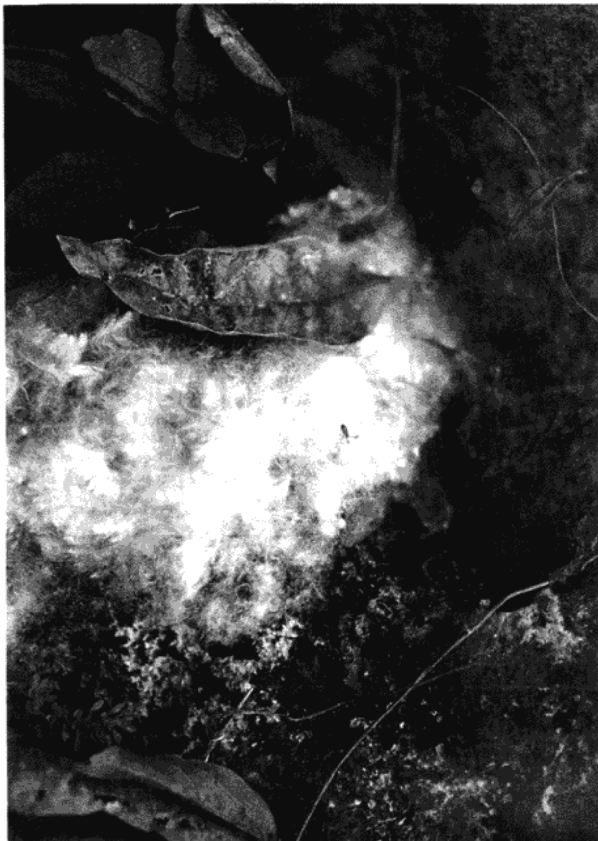
Semilla de ceiba. Pablo Ortiz Monasterio.

Las semillas después de desprenderse de la planta madre pueden quedarse muy cerca de ella o viajar muy lejos; en ambos casos a esto se le denomina: dis-