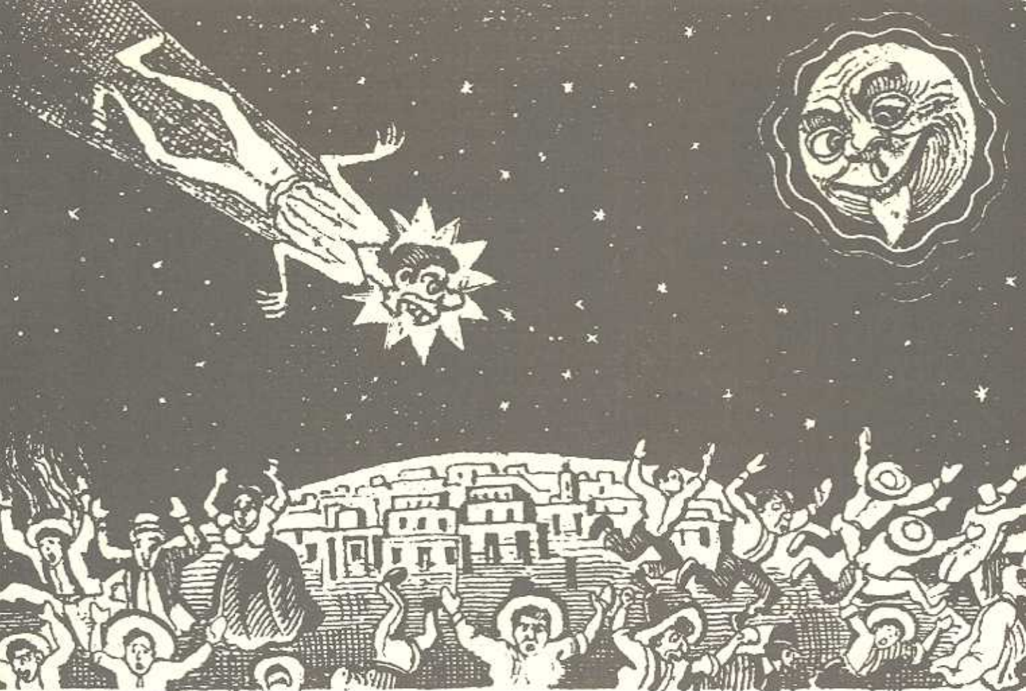
José Guadalupe Posada. El fin del mundo

ahora más de 31 asteroides han sido descubiertos, además, se establece que Plutón con su órbita elíptica poco usual, es el mayor de los cuerpos de este cinturón. Por su cercanía a Neptuno, los cuerpos del cinturón de Kuiper no son desestabilizados por estrellas rivales y muy raramente se introducen al interior del Sistema Solar.