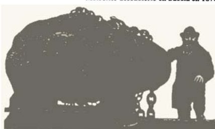
Meteorito descubierto en Suecia en 1870